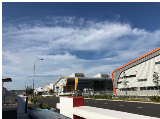
(工業団地内の様子)