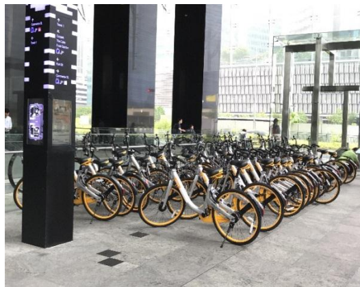
(公共駐輪場に整然と駐輪される自転車)

現在シンガポールでは、oBike 社、ofO 社、Mobike 社の計 3 社が、自転車シェアリング事業に参入し、しのぎを削っています。「スマホで乗り捨て自由」の手軽さがウリのシンガポール版・自転車シ