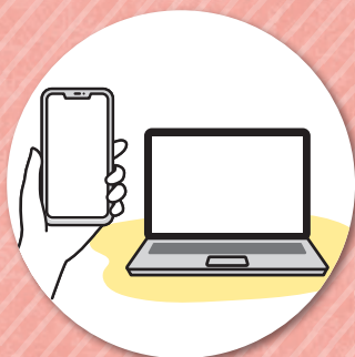
お手持ちのPC・スマホ・ タブレットでご相談可能