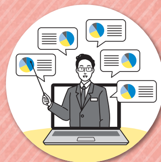
20社以上の保険会社から お客さまにあったプランをご提案