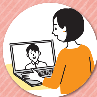
担当者の顔を見ながら 相談できるので安心