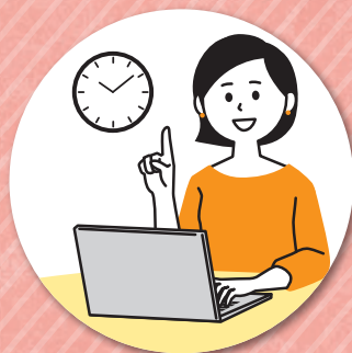
ご都合の良いタイミングで 相談できるので便利