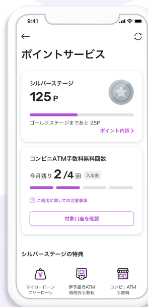
ポイントサービス